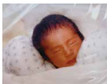
生まれて間もない頃の写真です。すでに面影がありますね。

それは日本経済全体が右肩上がりだった時代背景もあったのでしょう。当時、個人事業主であった父はほとんど年中無休で働いていました。たまにお店がお休み