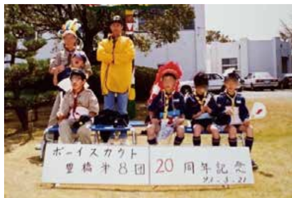
ボーイスカウトで「仮装して記念撮影」というコンセプトの集合写真。黄色い服が私ですが、設定が良く分かりませんね(笑)

そんな風に過ごしていた幼稚園の頃は、おとなしくてインドア派で色白の幼児だったのですが、小学生になって水泳に興味を持ちました。力強く前に進めるクロール