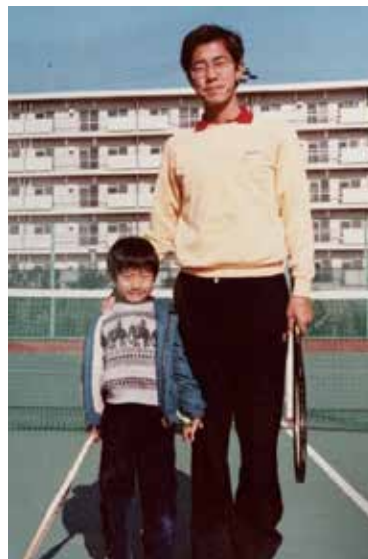
テニスコートで父と。

の日は、父の趣味である友人とのテニスの場についていくことになり、結局遊んでもらえずに不貞腐れていました。しかし、この時のテニスのご縁が三十代後半で自分の人生の糧になるとは、当時は思いもしませんでした。